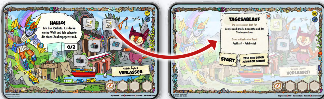
Das Wesen mit dem Flügel-Helm heißt Railisto. Es zeigt dir das Berufsfeld Verkehr, Logistik.